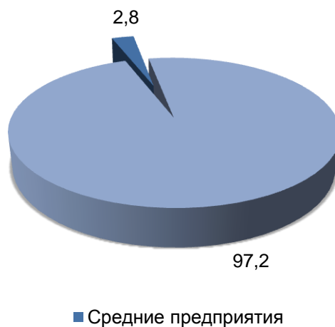
Удельный вес среднесписочной численности (без внешних совместителей) средних предприятий в среднесписочной численности работников (без внешних совместителей) организаций Республики Марий Эл в январе-сентябре 2023 года (в процентах)