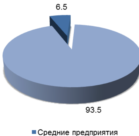
Удельный вес оборота средних предприятий в общем обороте организаций Республики Марий Эл в январе-июне 2023 года (в процентах)