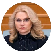
Куратор – Татьяна Голикова

ЦЕЛЬ: Повышение качества жизни пожилых людей и увеличение ожидаемой продолжительности жизни к 2030 году до 78 лет, а к 2036 году – до 81 года.