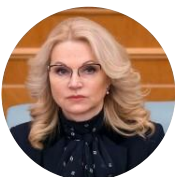
Куратор — Татьяна Голикова

ЦЕЛЬ: достижение высокого уровня технологического суверенитета в области медицинских технологий, производства лекарств и изделий, повышение продолжительности и качества жизни граждан путем внедрения инновационных технологий в здравоохранение.