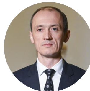
Дмитрий Григоренко Вице-премьер