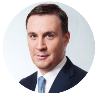
Дмитрий Патрушев Вице-премьер